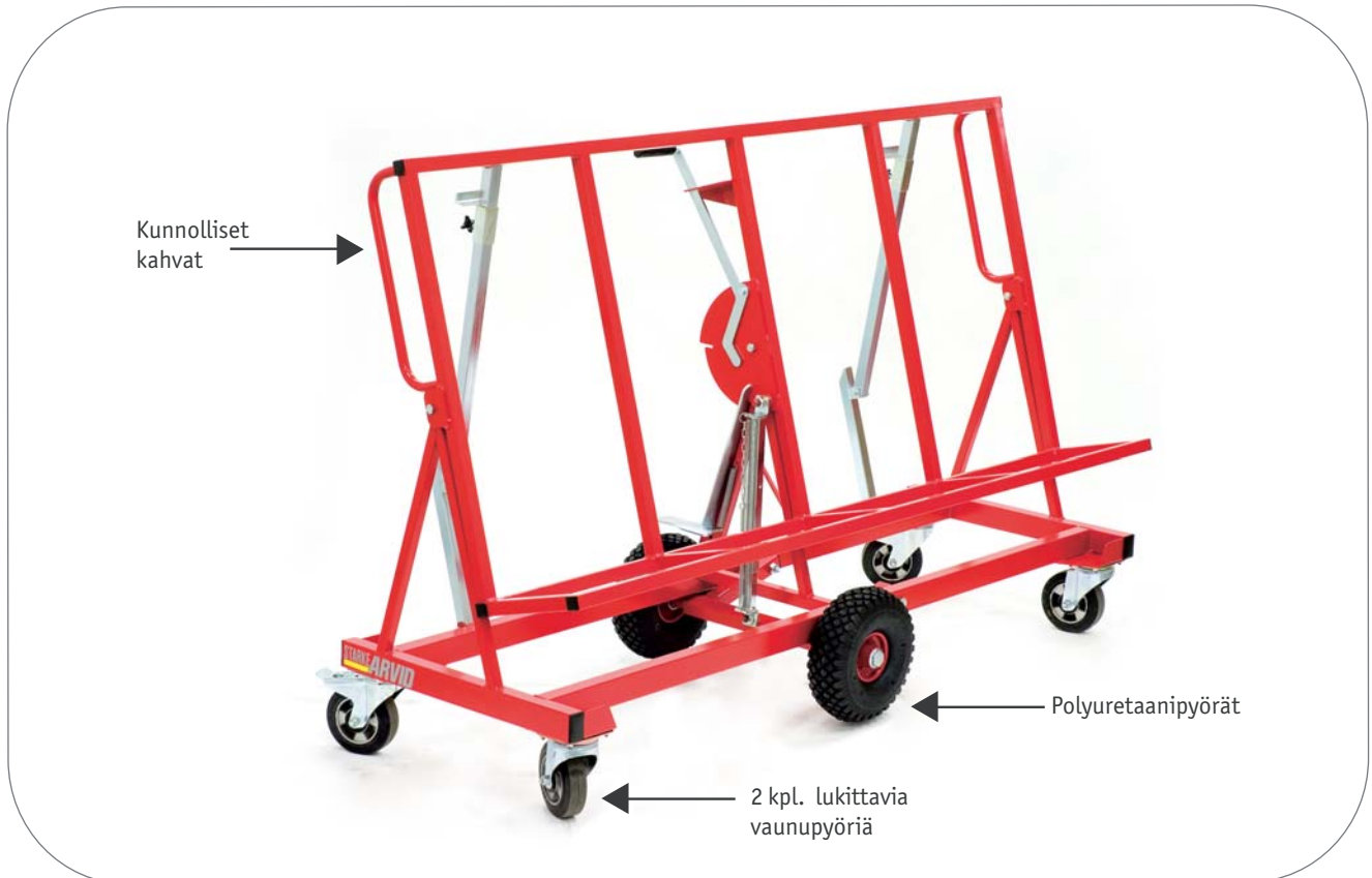
900 mm vaunu kokoonpantuna