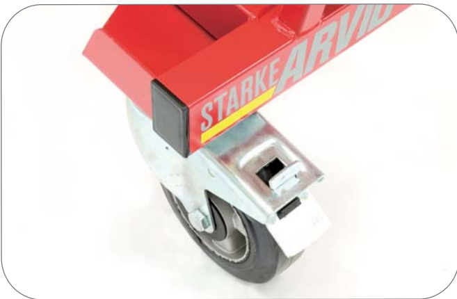
2 kpl. jarrullisia vaunupyöriä